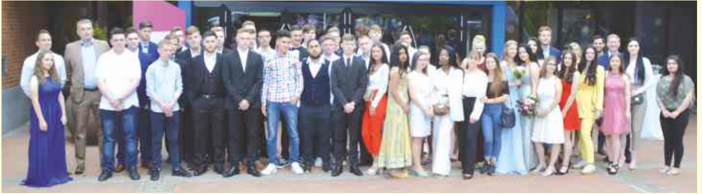
Abschlussjahrgang 2019: 17 Schülerinnen und Schüler haben an der Oberschule Belm einen Realschulabschluss Sek I erreicht, 13 einen erweiterten Realschulabschluss. 14 Schülerinnen und Schüler verlassen die Schule mit einem Hauptschulabschluss, 7 haben keinen Abschluss.