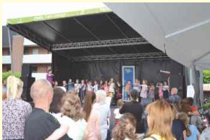
Die Kinder der Kita St. Josef machten mit Liedern und Tänzen den Auftakt des Bühnenprogramms beim 19. Begegnungsfest „Power in Powe“ auf dem Belmer Marktplatz.