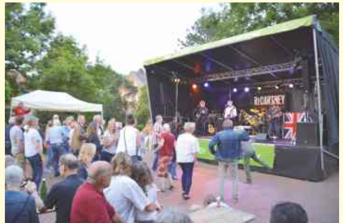
Auf dem Platz vor der Bühne wurde begeistert getanzt.

Mit ReCartney machte eine der erfolgreichste Beatles-Tribute-Bands Station in Belm. Bei bestem Konzertwetter und sommerlichen Temperaturen war vom Verein Belmer Mühle als Veranstalter alles für einen schönen Konzertabend vorbereitet. Für das leibliche Wohl hatte das Team der Belmer Integrationswerkstatt ein sehr gutes Angebot vom Grill, aber auch Fingerfood vorbereitet. Für ein reichhaltiges Getränkeangebot war durch Franz Klenke und Team sowie einem Weinstand des Vereins ebenfalls gesorgt.