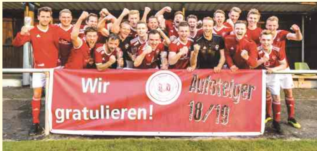
Die 1. Herren des SuS Vehrte freut sich über den Aufstieg in die erste Kreisliga.

Die 1. Herren des SuS Vehrte hat sich nach einem hart umkämpften Aufstiegsrennen am vorletzten Spieltag mit einem 6:1 Auswärtserfolg bei Viktoria Gesmold III die Meisterschaft in der 1. Kreisklasse Süd B gesichert. Damit feiern die Vehrter nach 5 Jahren Abstinenz den Wiederaufstieg in die Kreisliga Süd.