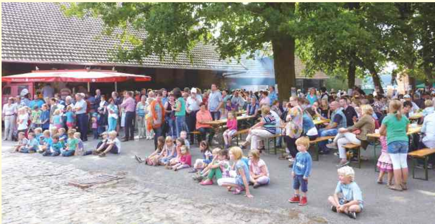
Unter dem idyllischen Baumbestand des Innenhofes bieten die Organisatoren neben Unterhaltung und Information auch eine Cafeteria an.

Nach längerer Pause steht wieder ein Hoffest gegen den geplanten Bau der A33 Nord an. Gefeierte und über den Stand der Planungen informiert wird auf dem Hof der Familie Nordmann in Icker (Lechtinger Straße 93). Veranstalter sind die Gemeinden Belm und Wallenhorst, die Bürgervereine Icker und Wallenhorst, das Umweltforum Osnabrücker Land sowie die Arbeitsgemeinschaft „Besseres Verkehrskonzept“.