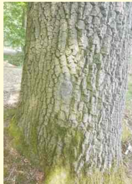
Kleinräumiger Eichenprozessionsspinner-Befall an einer Eiche in einem Waldstück in Belm-Vehrte.

Informationen über den Eichenprozessionsspinner und Verhaltensregeln bei Bekanntwerden eines Baumbefalls stehen auf unserer Webseite unter www.belm.de/eichenprozessionsspinner .