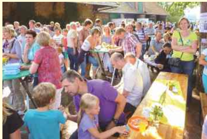
Auf einen ebenso guten Zuspruch wie 2014 hoffen die Organisatoren des Hoffestes.

Am Sonntag (18. August) startet um 11 Uhr ein Familienfest mit einer Mischung aus Unterhaltung und Information (aktueller Planungsstand zur A33-Nord, mögliche Klageoptionen nach dem