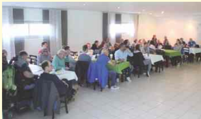
Aufnahme in die Versammlung.