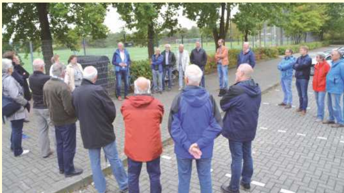
Bürgerforum vor dem Kindergarten in Icker.

Als „Sanierungsforen“ in den Sanierungsgebieten der Sozialen Stadt an der Stettiner Straße und am Marktring hatten sich die Sprechstunden mit Lokaltermin bewährt. Seit 2019 gibt es diese Sprechstunden als „Bürgerforen“ auch mindestens einmal im Jahr in jedem Ortsteil. Die ersten Bürgerforen fanden im Februar in Belm und Vehrte statt, in Icker, Haltern und noch mal in Belm wurde im September unter freiem Himmel mit dem Bürgermeister getagt.