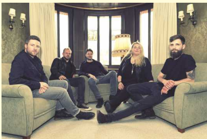
Neben einem breiteren Rahmenprogramm für Kinder gibt es bei der Belmer Herbstkirmes auch Livemusik. Den Auftakt auf der Kirmesbühne an der Lindenstraße macht am Freitagabend, 11.10., nach dem Freibieranstich die „Strohband“ aus Hagen a.T.W.

Im Anschluss an den Rundgang ist um 18 Uhr die offizielle Eröffnung der Kirmes mit Freibieranstich auf der „Leimkuhlen“-Wiese gegenüber dem Ärztehaus. Anschließend spielt die „Strohband“ aus Hagen bis 22 Uhr allerbeste Livemusik.