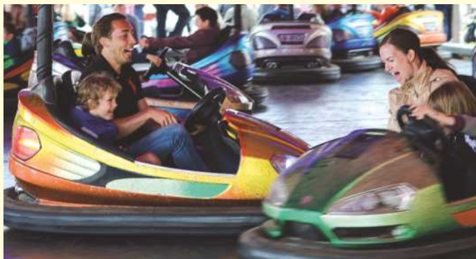
Spaß für Groß und Klein garantiert auf der Belmer Herbstkirmes neben Fahr- geschäften wie „Musikexpress“ und „Shaker“ auch traditionell der Auto- Scooter mit Standplatz am Tie.

Zuvor gibt es bereits am Freitagnachmittag von 15 bis 17 Uhr „Happy 2Hours“ - für „einmal zahlen“ dürfen Karussellbesucher „zweimal fahren“.