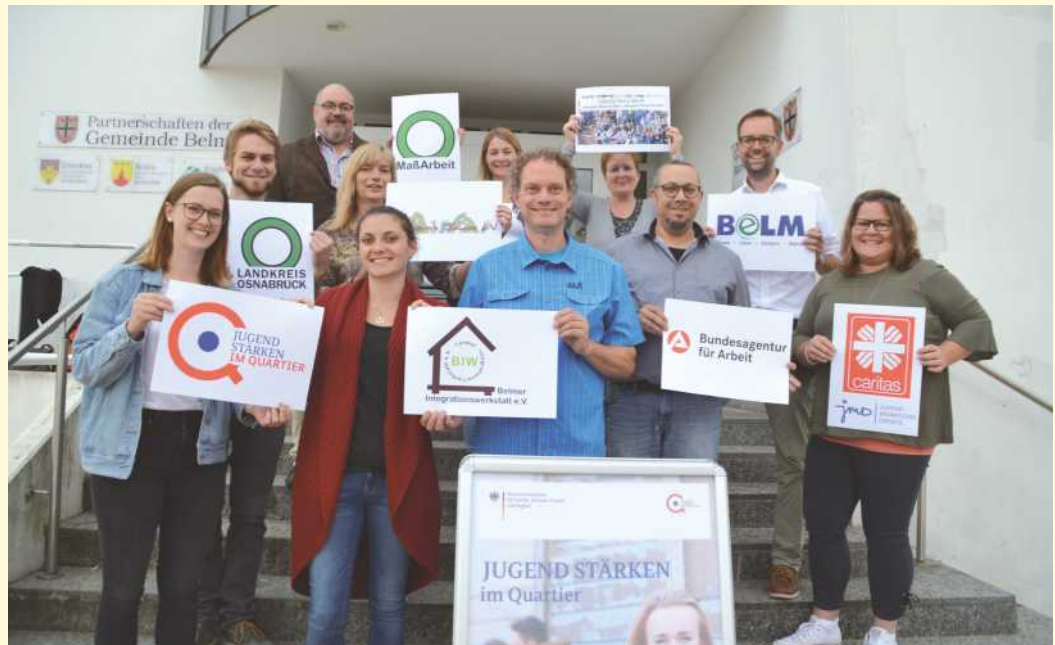
Bei der jüngsten Sitzung des Integrationsbeirates zum Projekt „JUSTiQ - Jugend stärken im Quartier“ trafen sich jetzt Vertreterinnen und Vertreter der Gemeinde Belm, der Belmer Integrationswerkstatt und der Oberschule Belm, der MaßArbeit, Pro Belmer Jugend und der Bundesagentur für Arbeit sowie vom Fachdienst Jugend des Landkreises Osnabrück und des Jugendmigrationsdienstes der Caritas.

Das Programm „Jugend stärken im Quartier“ wird durch das Bundesministerium für Familie, Senioren, Frauen und Jugend (BMFSFJ), das Bundesministerium des Innern, für Bau und Heimat (BMI) und den Europäischen Sozialfonds (ESF) gefördert.