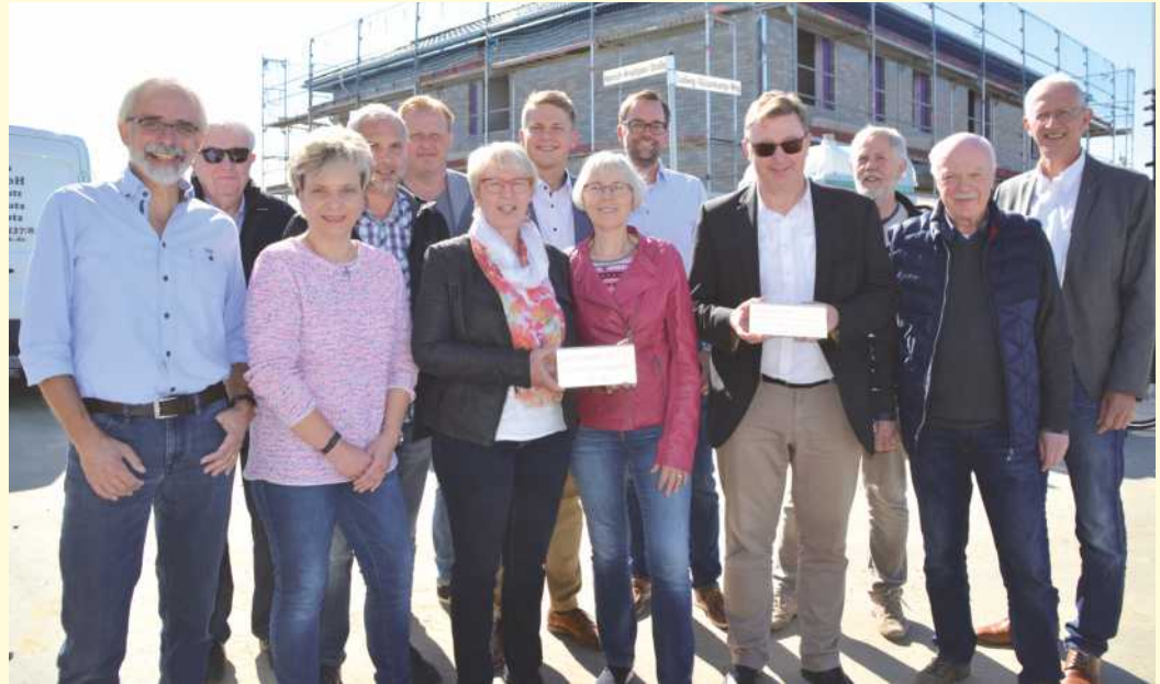
Im neuen Baugebiet „Östlich Up de Heede“ werden zwei Straßen nach Ludwig Glüssenkamp und Heinrich Kreutzjans benannt. Wer die beiden Belmer Persönlichkeiten waren, wird künftig auf kleinen Zusatzschildern am Straßennamen erläutert. Die Schilder wurden jetzt mit Familienmitgliedern, Weggefährten, Vertreterinnen und Vertretern von Verwaltung und Gemeinderat vorgestellt. Auch fünf weitere Straßen in Belm erhalten demnächst Erläuterungsschilder zum Namensgeber der jeweiligen Straße.