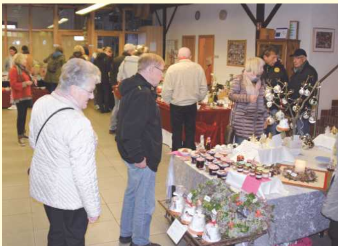
In der Belmer Mühle gibt es am Sonntag, 28. Oktober 2018, wieder ein reichhaltiges Angebot der Aussteller beim Herbstmarkt des Vereins Belmer Mühle – wie immer lohnt ein Besuch.

Der Sonntagsspaziergang am 27. Oktober 2019 kann neben dem Besuch der mehr als 30 Aussteller auch mit einer gemütlichen Pause in der Cafeteria des Vereins im Gesellschaftsraum der Mühle bei Kaffee und Kuchen verbunden werden. Auf dem Außengelände bietet die Interessengemeinschaft Erzgebirgspyramide wieder die leckeren Kartoffelpuffer an.