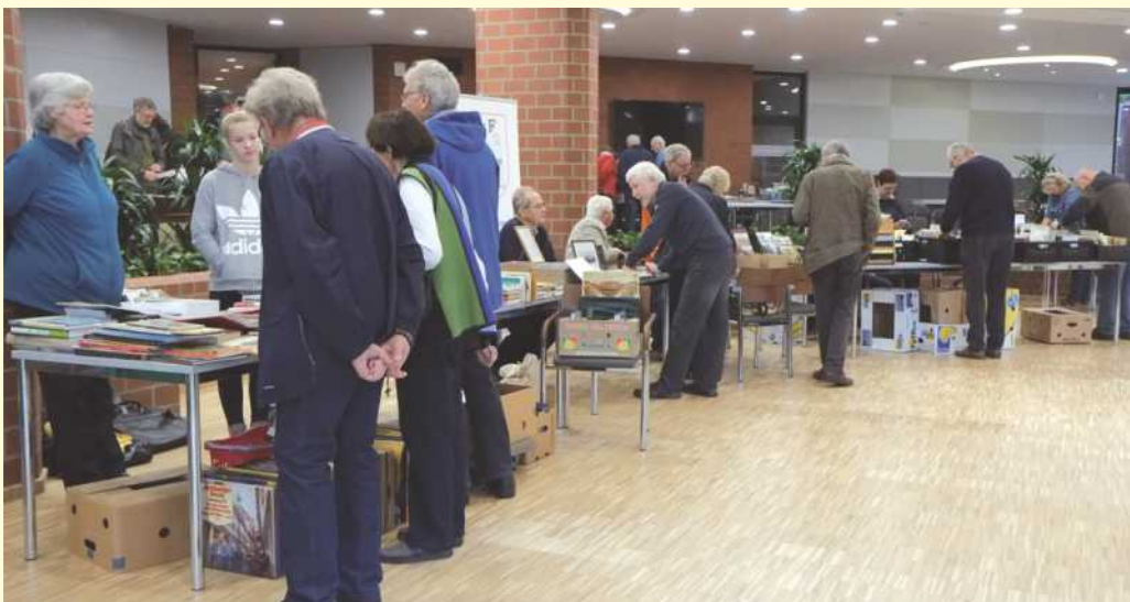
In den hellen Räumen des Kreishausrestaurants findet am 26. Oktober 2019 von 10 bis 15 Uhr die nächste Regionale Bücherbörse für das Osnabrücker Land statt.

Thema „Unterwegs“ tatsächlich viel Spielraum lässt: Reiseberichte sind gefragt; Bücher und neue Medien über Städte, Länder und Kontinente sowie regionale Ortsbeschreibungen und Wanderkarten passen ebenso ins Angebot. Daneben hoffen die Verantwortlichen auf Literatur über Automobile, Eisenbahnen, Flugzeuge und andere Fortbewegungsmittel. Natürlich besteht weiterhin das bekannte Angebot aus Sachbüchern aller Art, Belletristik, Druckgrafik, Ansichtskarten, Landkarten und Briefmar-