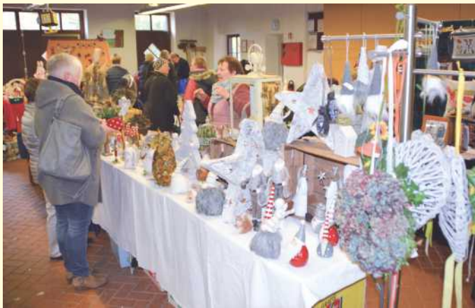
Bei Gesprächen mit den Ausstellern gibt es immer auch Informationen zur Herstellung der Produkte.