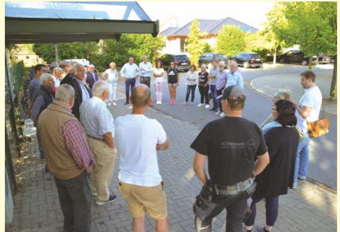
Bürgerforum im September in Belm am Sportzentrum am Heideweg.

In Icker war es der Verkehr auf der Landesstraße 109 (Lechtlinger Straße) und „Hinter dem Felde“, der Anlass zur Klage gab. Nachfragen gab es auch zu überlaufenden Regenwasser-Einläufen an Gemeindestraßen, der Busanbindung und der unzureichenden Mobilfunkversorgung.