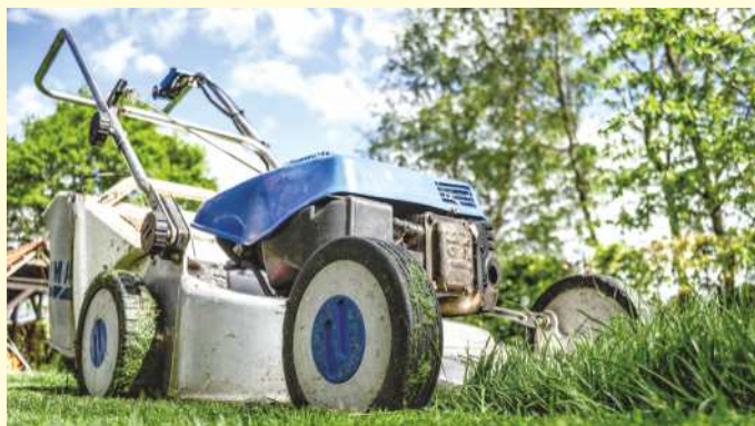
An Werktagen hat der Rasenmäher auch von 13 bis 15 Uhr Mittagspause.

Zwar muss das Grillen in den Sommermonaten von den Nachbarn grundsätzlich im üblichen Umfang geduldet werden. Gleichzeitig muss jedoch auch auf möglichst wenig Qualm und störende Rauchentwicklung geachtet werden. Gleiches gilt für die so genannten „Feuerkörbe“, die an lauen Frühlings- und Sommerabenden romantisches Flair verbreiten sollen.