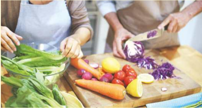
Jeder der acht Kochabende steht unter einem anderen Thema. Teilnehmer erfahren unter anderem, wie sie regionale und saisonale Zutaten verwenden und wie sie restefrei kochen, aber auch welche Klimabilanz Obst, Gemüse und tierische Produkte haben und was Lebensmittelsiegel für den Klimaschutz bedeuten. Eins haben alle Veranstaltungen gemein: In kleinen Gruppen und lo-