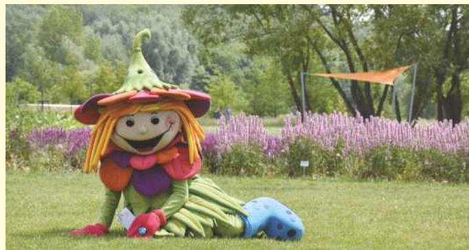
Das Maskottchen der Landesgartenschau in Bad Iburg - Rosa Lotta.