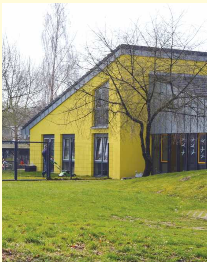
An der Kindertagesstätte in Belm-Astrup soll in diesem Jahr ein Anbau für zwei Krippengruppen entstehen. Die Räume der vorhandenen Krippengruppe im Neubau von 2013 werden dann zu einer Regel-Kindergartengruppe umfunktioniert.

Der Verwaltungsausschuss (VA) der Gemeinde Belm hat in seiner jüngsten Sitzung die Planungen für den Bau von neuen Krippen- und Regelkindergartengruppen an den beiden Kindertagesstätten in Astrup und Vehrte beschlossen. Im Bildungsausschuss sind die Planungen bereits Ende Februar vorgestellt worden. Vorgesehen war allerdings in Astrup nur eine Regelkindergartengruppe. Jetzt soll auch gleich eine zusätzliche Krippengruppe gebaut werden. In Vehrte soll durch einen Anbau am Kindertagesgebäude Platz für zwei Gruppen entstehen. Die Räume der jetzigen Krippengruppe werden dann als Personal- und Besprechungsräume sowie als Ruheräume genutzt.